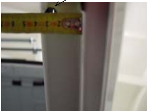
Vue de dessous